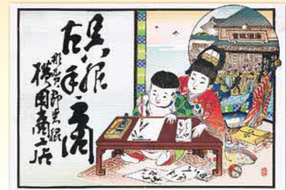
呉服古手商横田商店(那賀郡岩脇)